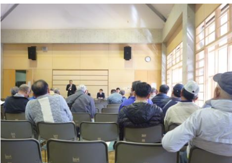
清久地区の説明会で