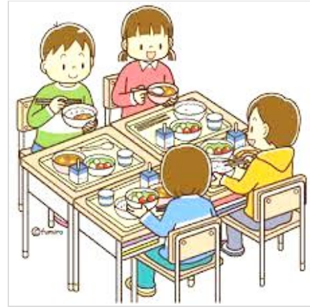
楽しい給食の時間です

給付の仕方は、保護者がいったん納付し、その後10月と次年度3月に保護者が指定する口座に振り込まれます。 対象人数は286人、財源は1千4百万円 私たちは、完全無料化を目指していますが、当面の措置として第2子半額、第3子以降無料を提起し続けてきました。対象者の第3子は2377人で私たちの提起は約7千万円で実現することができず。質問の中で「市長公約である事案については特別の予算を組んで、第2子も対象に加えるべきである」と求めましたが、姿勢は変わりませんでした。提起に沿った答弁ではありませんが、給食費の無償化に向けた取り組みが着実に実を結び、子育て世代の保護者の負担軽減につながりました。 引き続き多くの要望実現のため、市民の皆さんと運動を継続していきます。