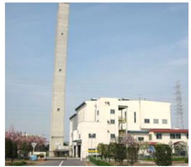
建て替え予定の菖蒲清掃センター

新たなごみ処理施設を菖蒲清掃センター一箇所に統合する計画が進んでいます。 これまで、ごみ処理基本構想と基本計画が策定され、さらにごみ処理施設の基本構想が策定され、施設の基本計画が進もうとしていました。ところが、今年になり、杉戸町と幸手市のゴミも新施設で燃やすという広域化が検討されています。 私たち日本共産党議員団は、ごみ処理施設の統合段階から、影響する近隣への説明を要求してきました。使える施設は継続使用すべきと訴えてきました。しかし、それをする事なく統合が進められ、広域化までされようとしています。 広域化には多くの議員から住民説明を要求され、11月末には、検討内容の説明会が始めて、菖蒲清掃センター近隣3カ所で開催されました。おもな意見は以下の通りです。