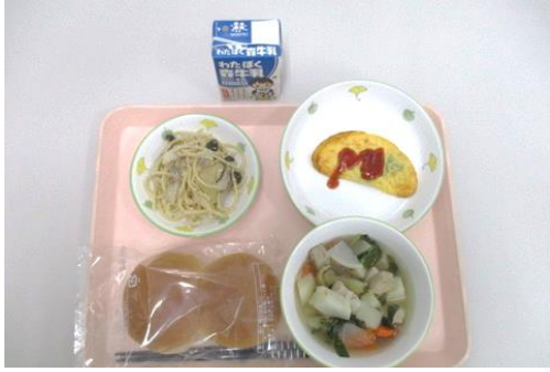
「きょうの給食」 12月18日 HPから はちみつパン 牛乳 ほうれん草オムレツ たらこスパゲティー（豆乳） 冬野菜のポトフ